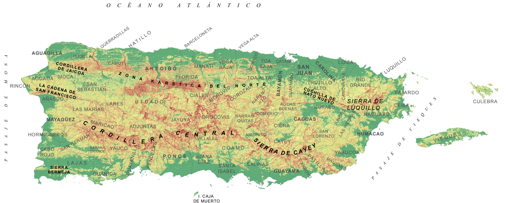
Por ciento de área ocupada